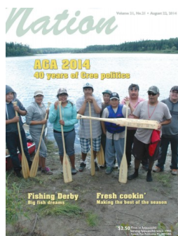
Nation Vol 21 No 21

Pour vous abonner à la liste de diffusion, contactez : odile.bergeron@inspq.qc.ca